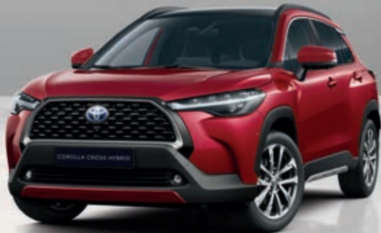
Opciones de colores monotono de Corolla Cross